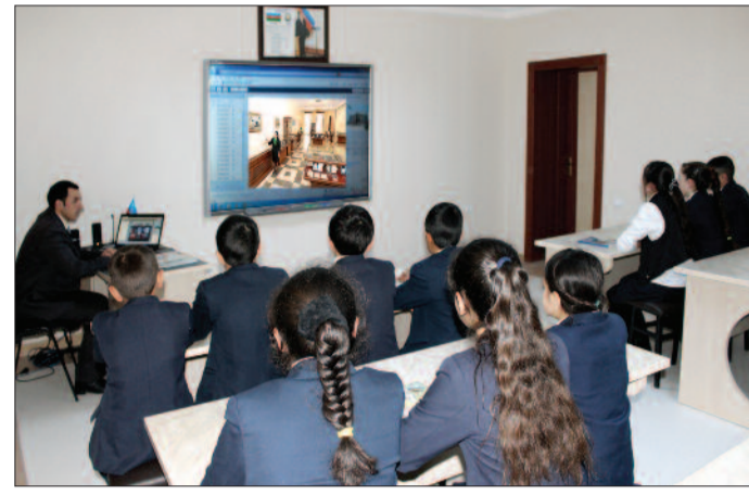
Şahbuz rayon Bığanək kənd tam orta məktəbi

Qeyd olunub ki, ötən əsrin sonlarında xalqımıza qarşı törədilmiş Xocalı faciəsindən 24 il keçir. Bu faciə iki yüz ilə yaxın bir müddətdə erməni şovinist millətçiləri tərəfindən azərbaycanlılara qarşı muntəzəm olaraq həyata keçirilən etnik təmizləmə və soyqırımı siyasətinin davamı, ən qanlı səhifəsidir. Faciənin törədilməsində məqsəd torpaqlarımızı ələ keçirmək, xalqımızın müs-