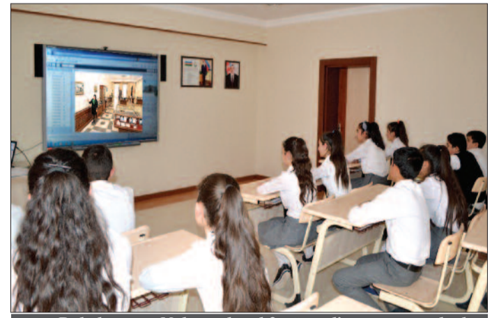
Babək rayon Nəhrəm kənd 2 nömrəli tam orta məktəb

təqillik və ərazi bütövlüyü uğrunda apardığı mübarizə əzmini qırmaq idi. Lakin xalqımızın qəhrəman oğul və qızları erməni-sovet hərbi birləşmələrinə qarşı qeyri-bərabər döyüşdə mərdliklə mübarizə aparıb, qəhrəmanlıq tariximizə şanlı səhifələr yazıblar.